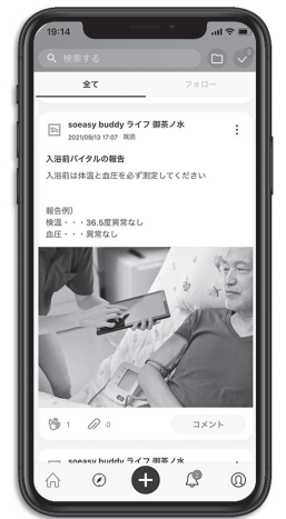
▲デモ画面のイメージ

とSNS機能であるチャット機能を備えたもので、2018年4月から販売しています。新入社員への研修などを動画撮影し、クラウド上に掲載することでスマホからいつでも手軽に確認が出来ます。チャット機能もあり、現場スタッフの気づきをチャット内で共有可能なため、各現場